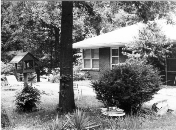
La pièce consacrée à Ra, vue de l'extérieur: la porte et les fenêtres de coin font partie de la pièce dans laquelle se sont tenues les séances avec Ra à partir de janvier 1981. ( Photo prise le 9 juin 1982. )